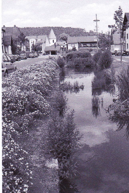
Von der Innenstadt barrierefrei durchs Landsgartenschaulgelände bis ins modellhaft dorferneuerte Neuses.

Stadt“ will ich auf die fortdauernde Notwendigkeit verweisen, Kronach „seniorengerechter“ und „behinderterfreundlicher“ zu machen. Das Aufzugsprojekt kann dabei nur ein Schritt sein, der aber zusammen mit vielen anderen ein System der Barrierefreiheit entstehen lässt, so z. B. mit den neuen Rampen am Pfarrzentrum, dem Aufzug im Gebäude selbst, oder auch dem Aufzug im Amtsgericht, usw. Alles auf einmal geht auch hier nicht, und es macht jedenfalls keinen Sinn, die Barrierefreiheit von der Festung