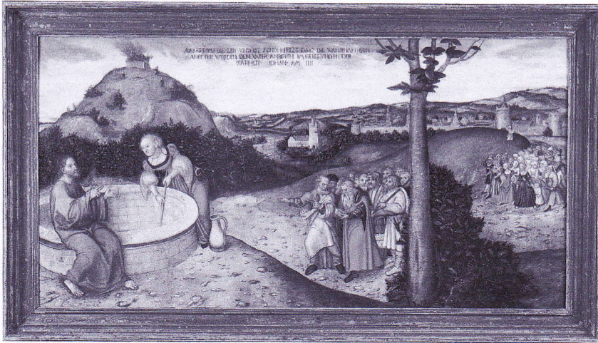
Im Cranach-Saal der Fränkischen Galerie auf der Festung Rosenberg hängt als Leihgabe das vom Verein „1000 Jahre Kronach“ erworbene Lucas-Cranach-Bild: Christus und die Samariterin am Jakobsbrunnen.