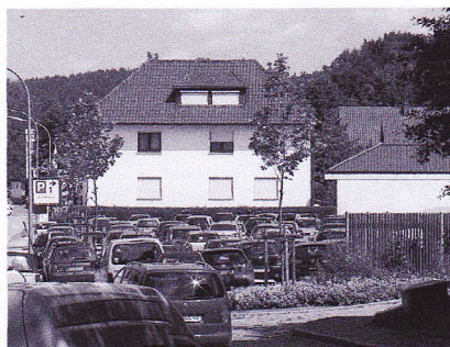
Am Krahenberg: Statt Schlachthof innenstadtnahe Parkplätze.

immer deutlicher ab, dass neue Nutzungen dominieren: spezielle Dienstleister, Gastronomie, Hotels - und Wohnen. Darin liegt die Zukunft der Oberen Stadt, und darauf sollten sich die Hauseigentümer ganz schnell mit positiven Begleitmaßnahmen einstellen. Schlussfolgerung also: Die Obere Stadt lebt! Sie ist der Geheimtipp für die Zukunft! Prägen Sie dieses Positiv-Image mit!