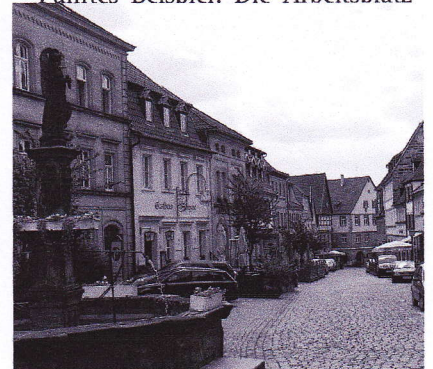
Geheimtipp Obere Stadt. Hier im Bild der historische Michaelsbrunnen in der Lucas-Cranach-Straße.